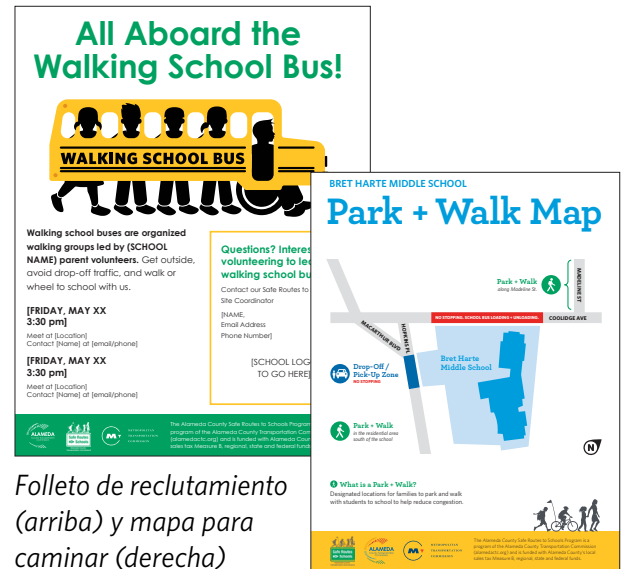
Folleto de reclutamiento (arriba) y mapa para caminar (derecha)

MATERIAL DE APOYO El equipo del programa de SR2S del Condado de Alameda tiene un número limitado de chalecos de alta visibilidad para los líderes de ruta y letreros de autobús escolar a pie para avisar a los participantes de los lugares de encuentro.