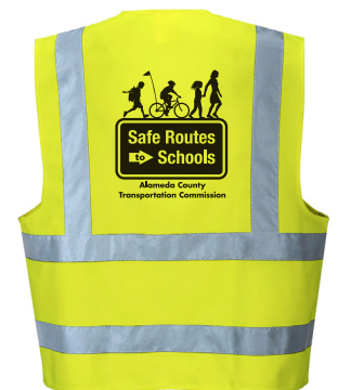
Chaleco de alta visibilidad