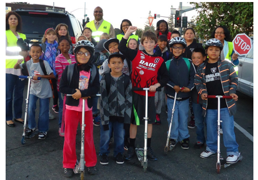
El director Hill (al centro, atrás) dirigiendo un Autobús Escolar a Pie con estudiantes y padres de familia voluntarios de Strobridge.

a Pie ganó popularidad y para finales de la semana tenía a más de 75 estudiantes participando. Ya que es el primer año que la escuela aplica el programa de Rutas Seguras a las Escuelas, el director Hill busca aprovechar la emoción y la fuerza de los Autobuses Escolares a Pie para alentar a las familias a seguir caminando y llegando en bicicleta a la escuela durante todo el año.